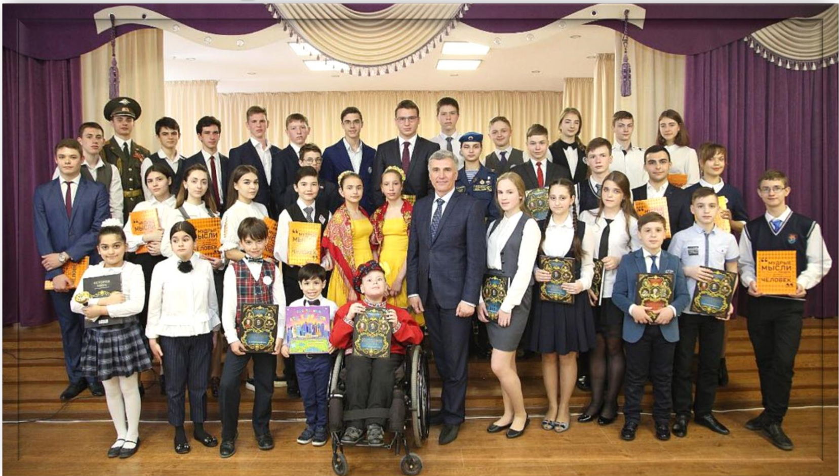
Участие в ежегодной встрече Главы города Пятигорска с одарёнными детьми