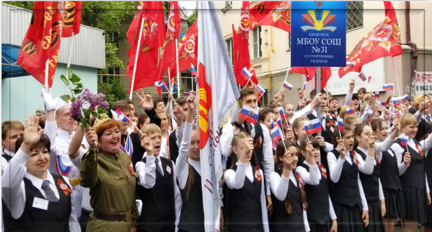
Участие в Параде Победы