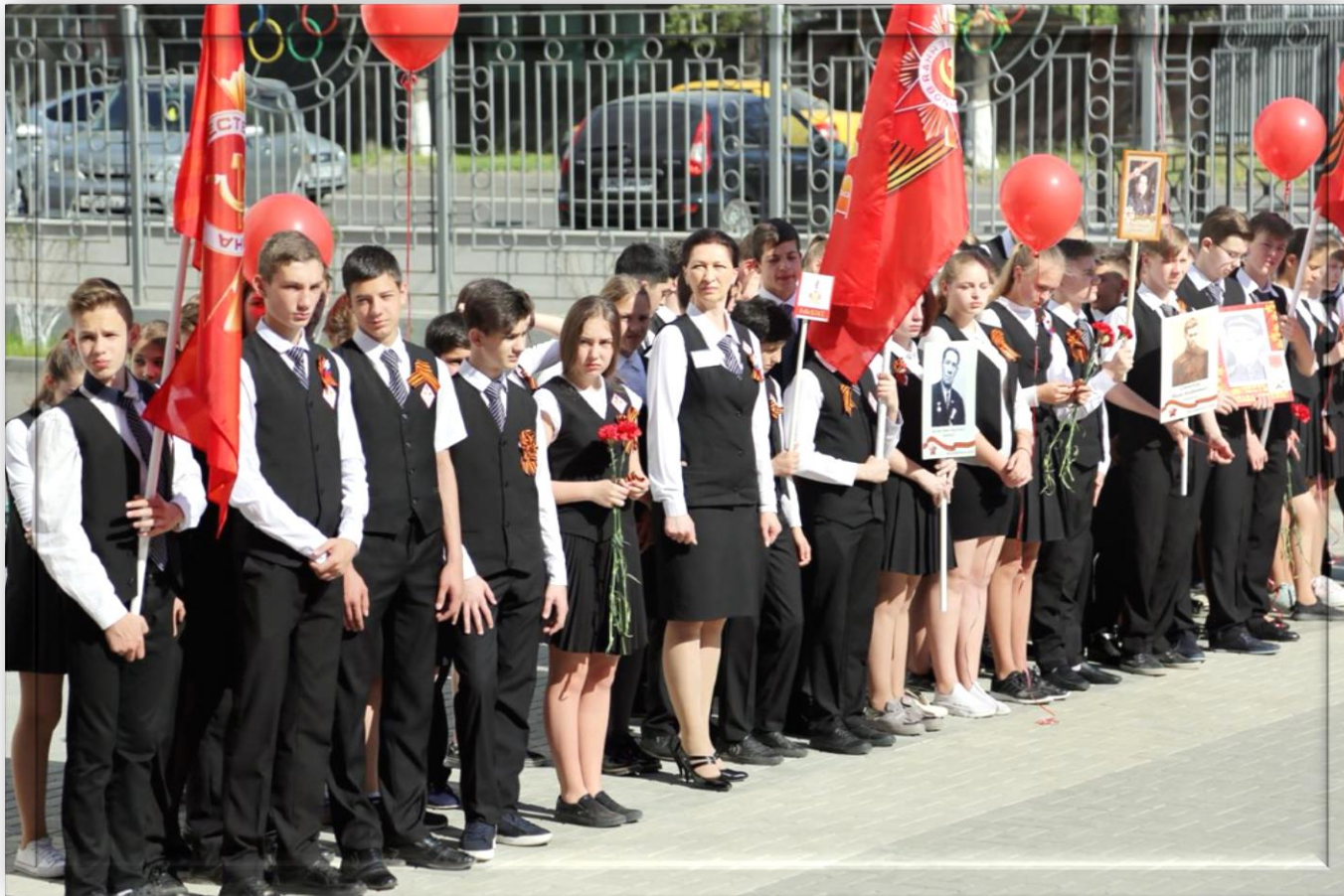
Митинг «Через года, через века – помните!»