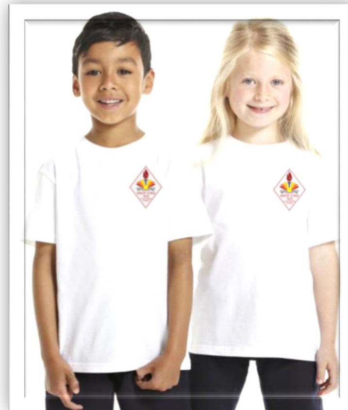
Классическая и спортивная форма обучающихся