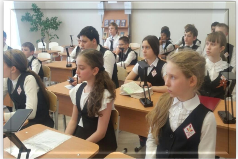
Читательская конференция «В книжной памяти мгновения войны»