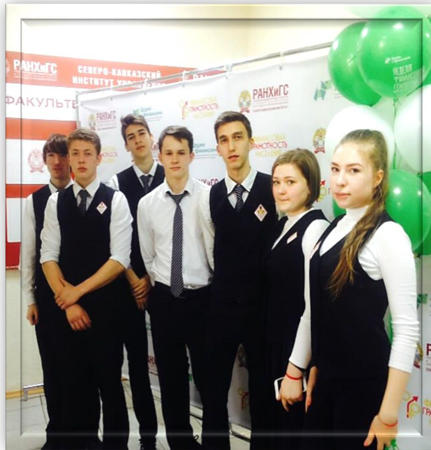
Участие в научно-практических конференциях