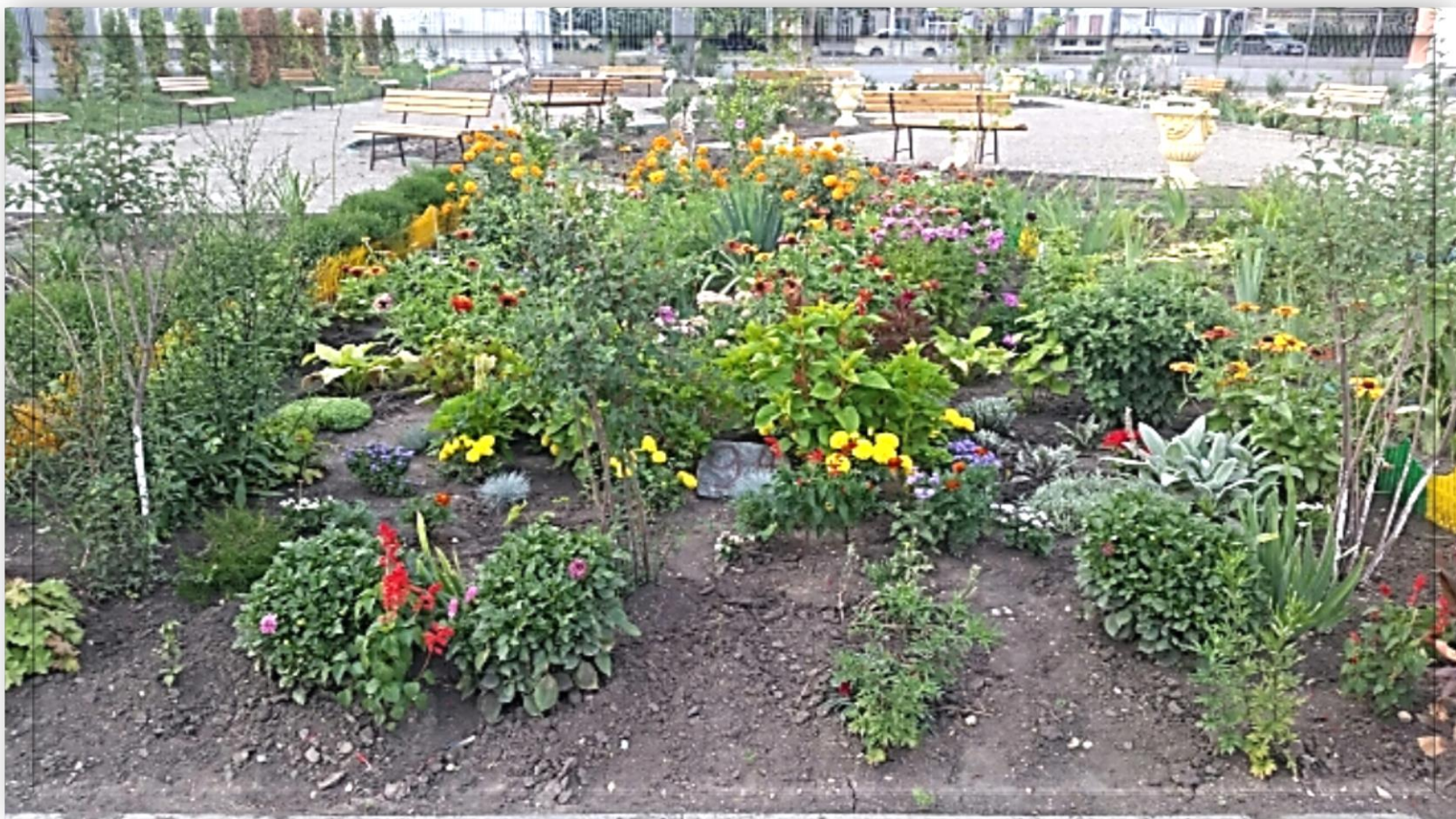
Уютные уголки школьного двора