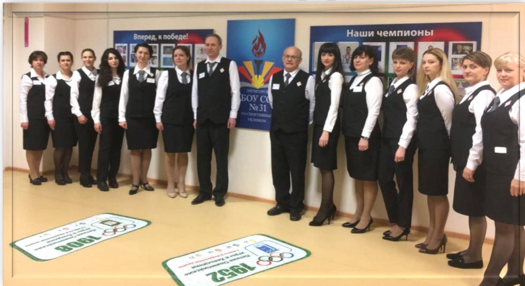
Традиционный деловой стиль в одежде педагогов