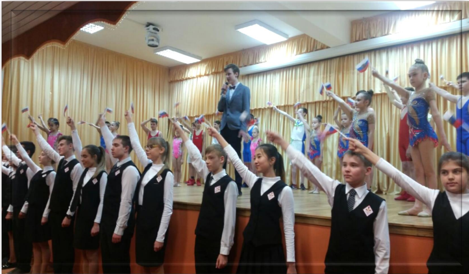
Региональный фестиваль национальных культур «Все мы – Россия!»