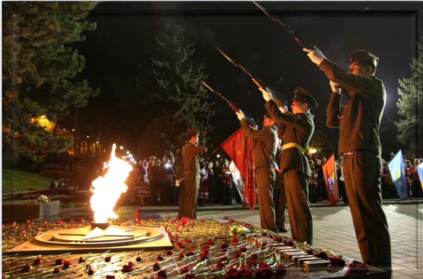
Участие в митинге ко Дню Памяти и скорби