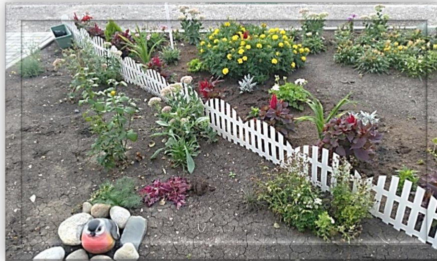
Проект «Цвети, родная школа!»