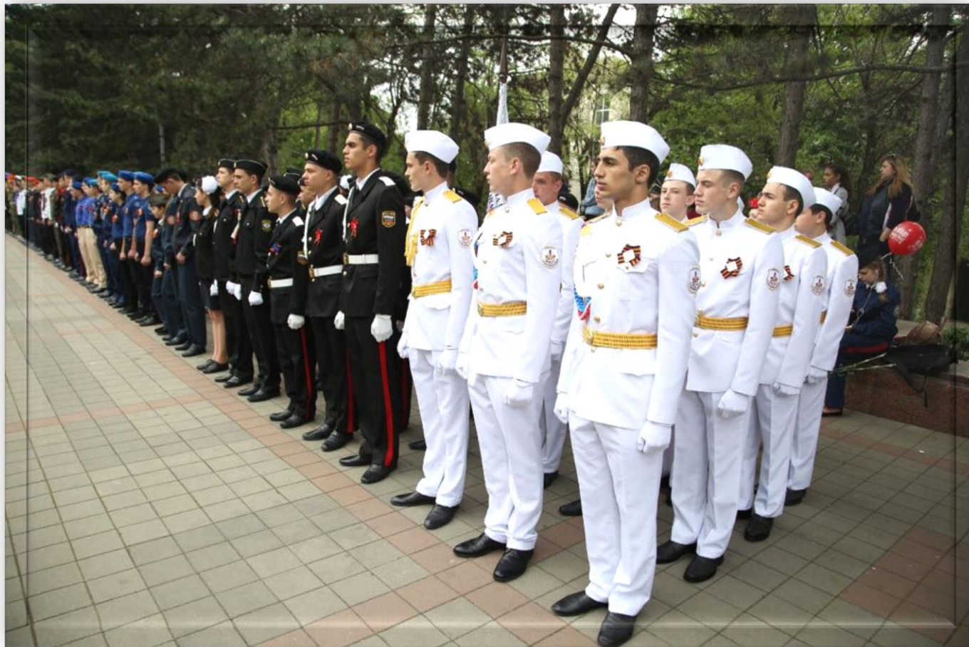
Участие в героической поверке